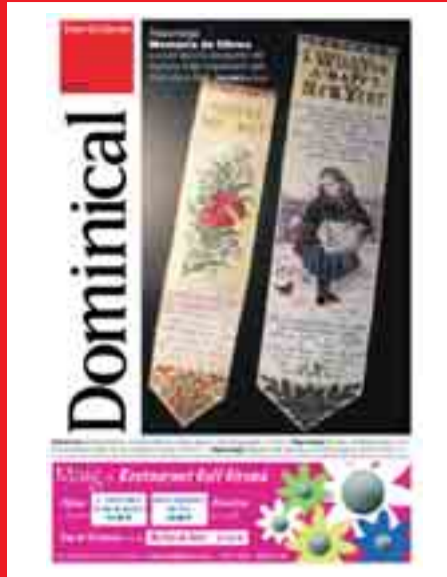
(PUNTS DE LLIBRE FETS A ANGLATERRA A FINALS DEL SEGLE XIX, DE LA COL·LECCIÓ DE MONTSE CASAPONSA I DOMÈNEC MARTÍNEZ)

TEXT: JORDI VILAMITJANA I PUJOL