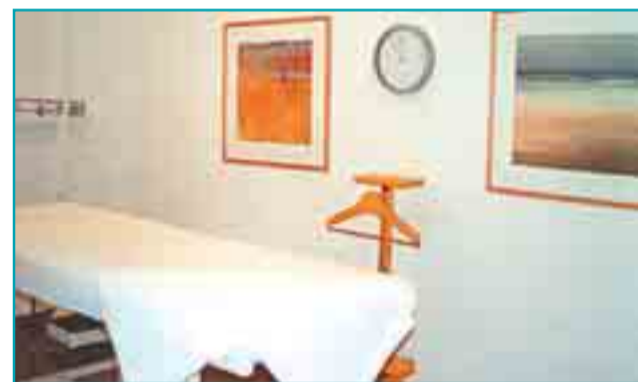
HoloVital té unes modernes instal·lacions al mateix centre de la ciutat de Girona.